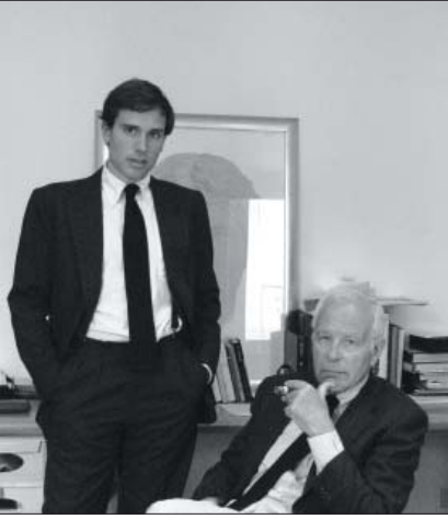
Giorgio und Gianni Bulgari.

In der jüngsten Vergangenheit wurden zwischen Dezember 2005 und Mai 2007 in rascher Folge drei Geschäfte eröffnet, grossartige Schmuckkollektionen unter vielsagenden Namen – «lips», «faces», «coquillage» und «lion».